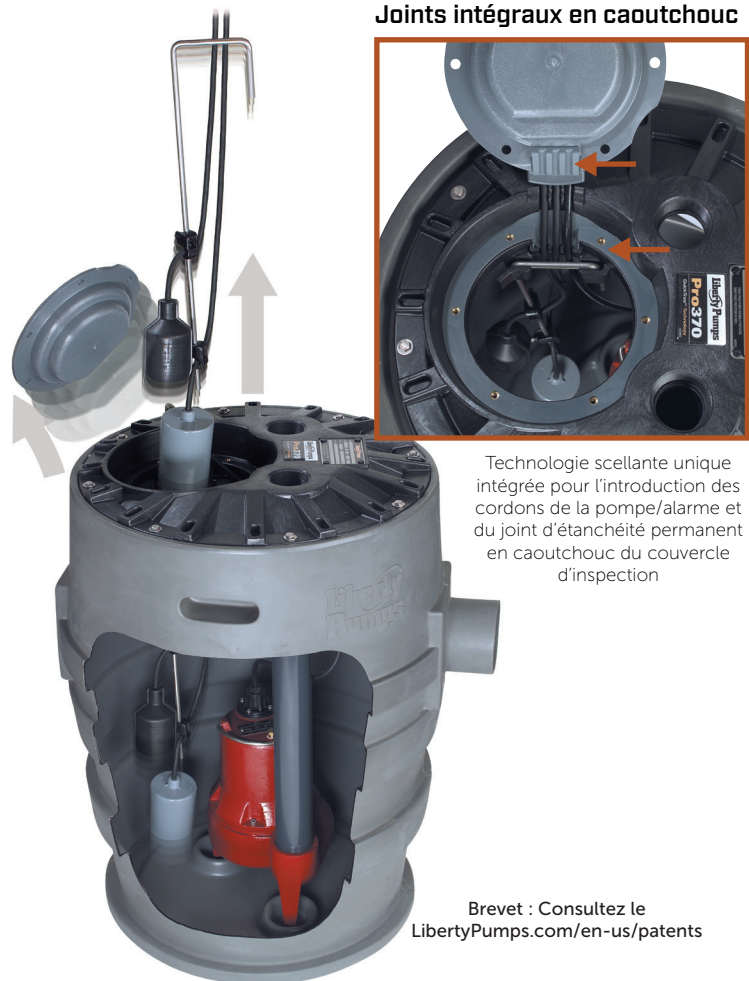
Joints intégraux en caoutchouc

Technologie scellante unique intégrée pour l'introduction des cordons de la pompe/alarme et du joint d'étanchéité permanent en caoutchouc du couvercle d'inspection